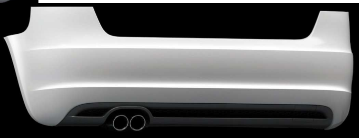
Facelift ab Modelljahr 2009 S3- Heck