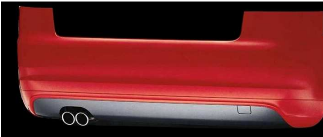
Vorfacelift bis Modelljahr 2008 S3- Heck