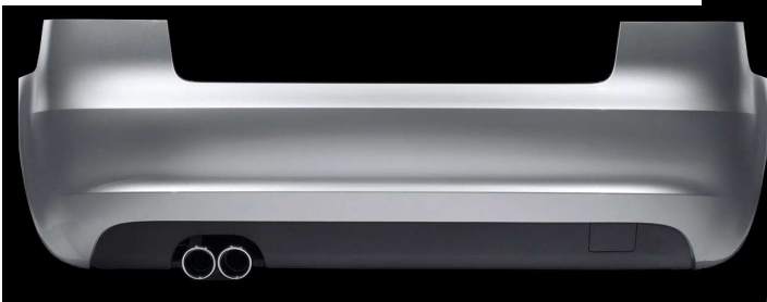
Facelift ab Modelljahr 2009 S-Line- Heck