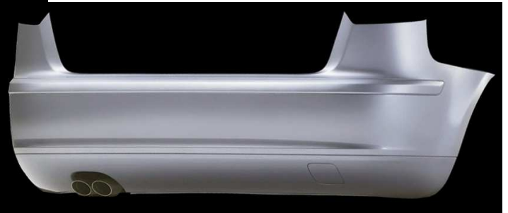
Vorfacelift bis Modelljahr 2008 S-Line- Heck