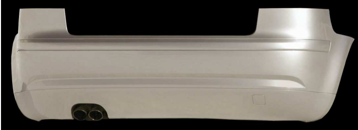
Vorfacelift bis Modelljahr 2008 Standard- Heck (3- Türer)